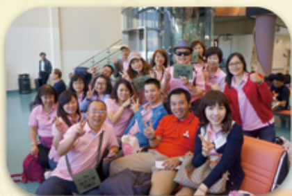
登機前的歡樂笑靨