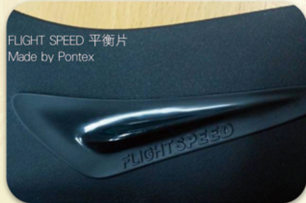
FLIGHT SPEED 平衡片 Made by Pontex