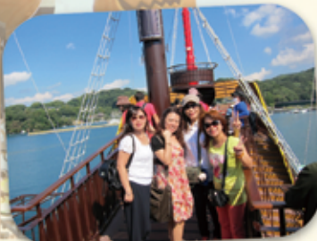
遊覽「九十九島」探訪海島交織美景