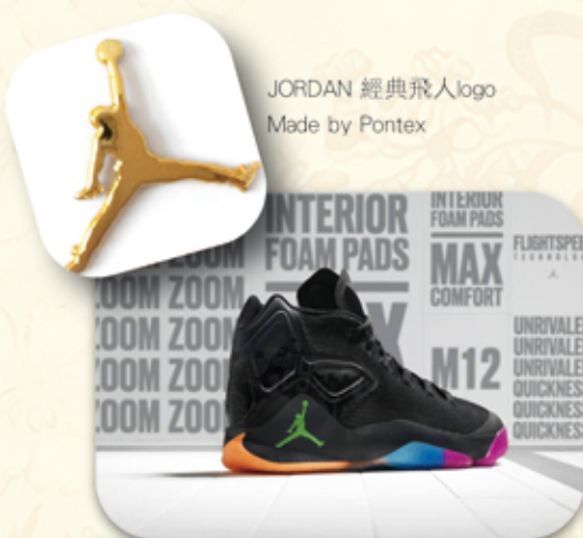
JORDAN 經典飛人logo Made by Pontex