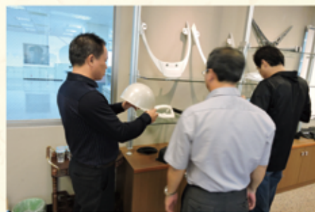
■ 來訪貴賓參觀Show Room複材產品及工廠實景

襄助甚多。待未來邦泰完成建廠後，包括在器材及複材兩大產業上，預計彼此將會有更多方面的合作機會，成為越南邦泰重要的打拼夥伴。