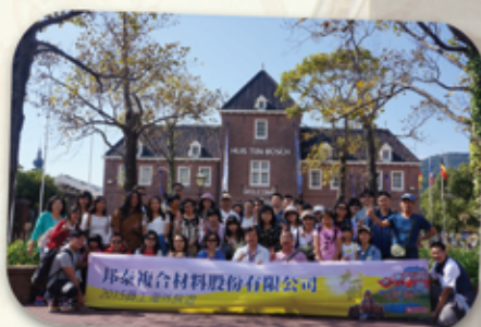
暢遊九州最大主題樂園-「豪斯登堡」