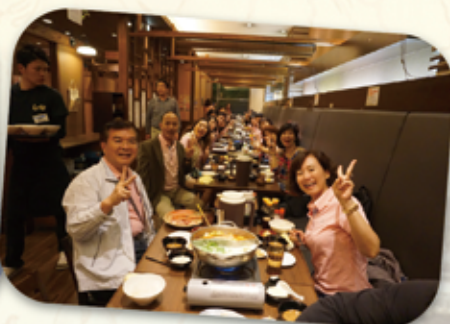
日本第一餐-享用九州風味御膳