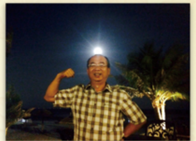
頂著越南明月光,總經理為邦泰即將到來的春暖花開振臂歡呼

Motivation is what gets you started. Habit is what keeps you going. You cannot change your destination overnight, but you can change your direction overnight.新邦泰的未來需要大家用新思維繼續努力,請選擇和我們緊密走在這正確的方向上!