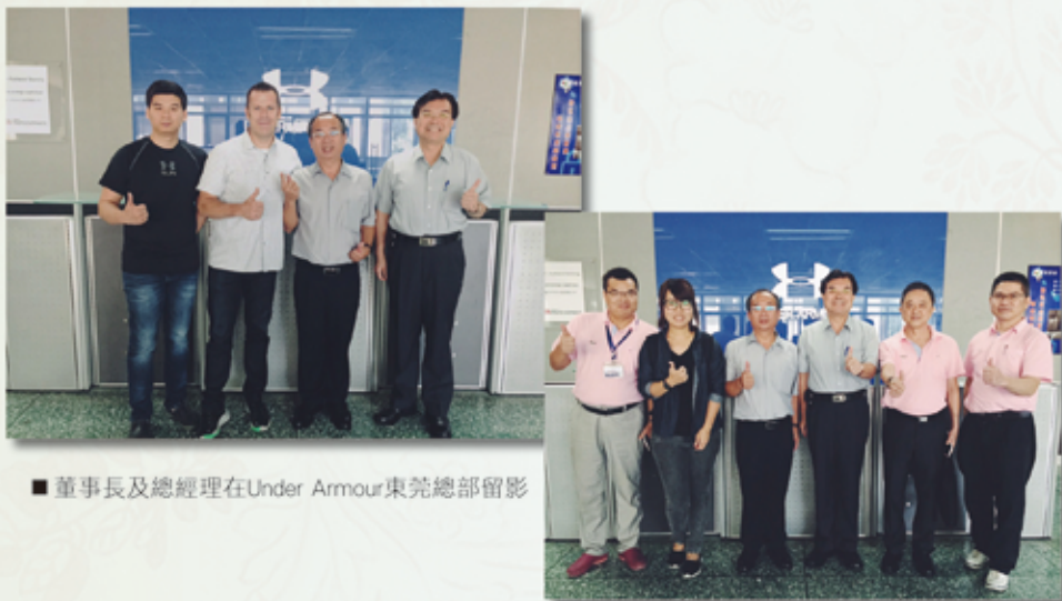
■ 董事長及總經理在Under Armour東莞總部留影

繼8月份邀請Under Armour亞洲區研發經理Vincent Chen親訪邦泰集團總部後，本公司董事長與總經理在此次出訪東莞，除了參訪台資鞋廠外，另一重要行程即為拜會Under Armour在東莞的總部，為雙方進行中的開發案持續加溫。Under Armour目前已晉升為全美第二大運動品牌，是邦泰全力爭取服務的重要客戶之一，董事長的快速親自拜訪，宣誓本公司對擁抱UA 品牌的最大重視！