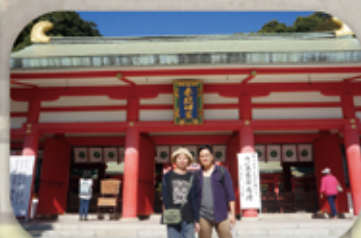
參訪歷史建物「春帆樓·赤間神宮」