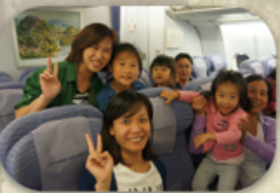
滿載行囊快樂回家