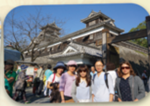
朝聖日本三大名城之一「熊本城」

10/16Day-2 →搭乘99島遊覽船+水族館+挖珍珠體驗→豪斯登堡→夜宿JR豪斯登堡大倉飯店