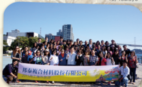
明治時期的國際貿易大港「門司港」大合照