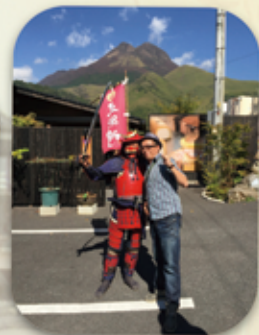
探幽晨霧與出泉之鄉 「湯布院·金鱗湖」

10/19Day5→門司港→春帆樓·赤間神宮→一蘭之森拉麵工廠→福岡機場→溫暖的家