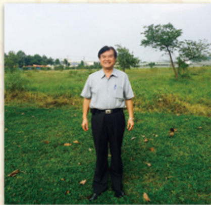
意氣風發站在越南土地上,董事長要帶領邦泰向全球進擊!

NOKIA如此,柯達、IBM何嘗不是如此!世界第一的企業,當面對科技新世界出現翻轉時,卻一再錯過學習、錯過改變,更重要的是錯過了『機會』,正因為他們只記得自己的優勢,輕忽了世界的趨勢,以致於錯過企業生存的機會。