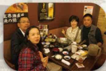
「博多運河城」內大快朵頤