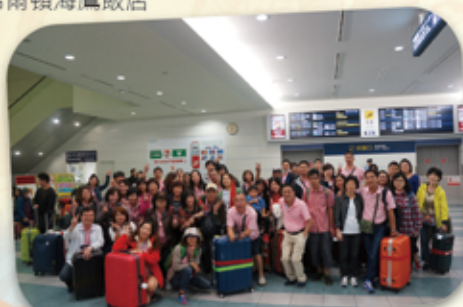
歷史性的留影—福岡機場