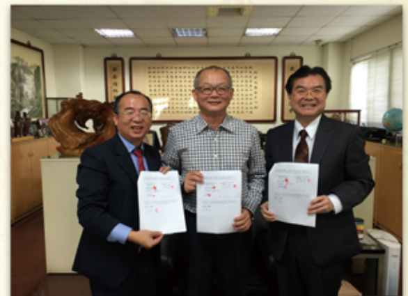
■ 簽訂土地轉讓合約

越南是中南半島五國中唯一同時加入TPP及RCEP兩個重要區域經濟組織的成員國,如此優越的產業發展條件,包括NIKE早已不斷催促器材事業前往設廠,尤其在東協區域經濟體已成型下,越南更佔盡著拓展市場的絕對優勢。當全世界的投資焦點都已轉往越南時,邦泰怎能再錯失這寶貴良機!