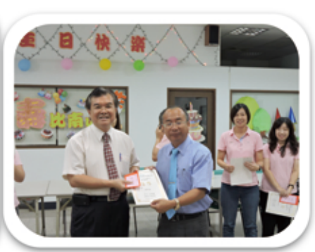
▲ 總經理頒發獎金獎狀給董事長