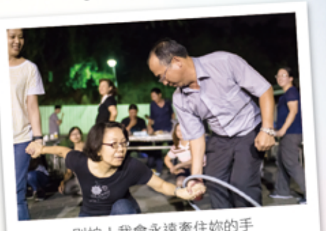
別怕！我會永遠牽住你的手

近兩年，邦泰的中秋晚會總會特別安排在暑假尾聲，讓同仁的小朋友可以在開學前，提前感受快樂的烤肉活動。今年在8/26(五)晚上，邦泰的福德廣場上，飄起了陣陣烤肉香，同仁攜家帶眷大快朵頤，董事長好友，彰化縣府黃啟堂顧問，連兩年偕夫人到場同歡，情愫十足。在福委會精心策劃下，由董事長、總經理等主管分組帶隊，玩起了踩汽球、呼拉圈接龍競賽遊戲，個個氣喘吁吁，參與度破表，加上邦泰新世代辣妹與業務小鮮肉的勁歌熱舞，讓整個晚會從頭一直High到腳……！