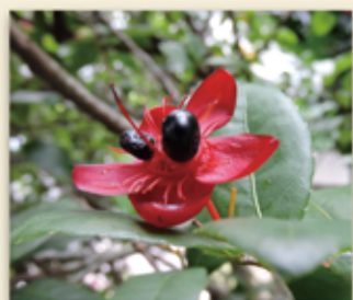
兩顆眼睛配上一副大耳 遠看像是可愛的米老鼠