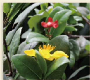
開在邦泰守衛室旁的桂葉黃梅花

《小百科》 桂葉黃梅 學名 Ochna kirkii 俗名米老鼠樹 (Mickey Mouse Plant)、金蓮木。