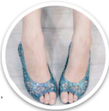
本公司已量產交貨 各款CROCS射出製品

本公司為CROCS (卡洛馳) 所代工生產的多款女性休閒鞋面，自8月份起已陸續交貨，亮麗的成品鞋並已在全球賣場熱銷中，這是邦泰器材成立30年來，最大一次成功為非運動鞋類生產的代表作，和CROCS的這次生產合作，將是邦泰器材規劃朝向全鞋代工的第一步。專業的開發技術與卓越的生產品質，從台灣出發，西向東莞、南進越南。