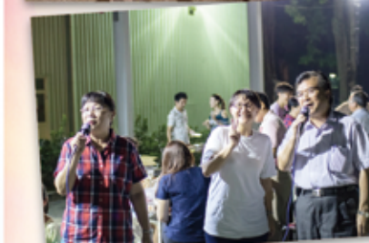
▲ 董事長與黃顧問夫人K歌