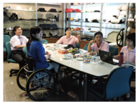
江老師聚精會神聆聽器材同仁業務簡報