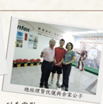
總經理賢伉儷與余家公子