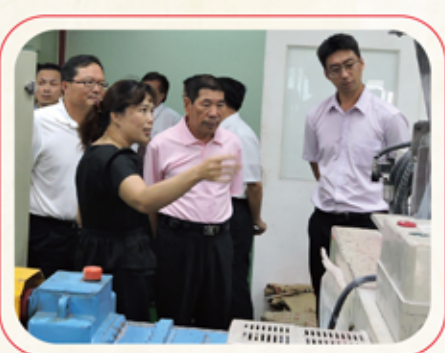
來訪貴賓參觀工廠實景