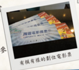
有模有樣的劃位電影票