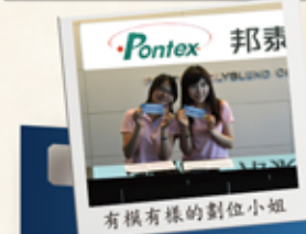
有模有樣的劃位小姐