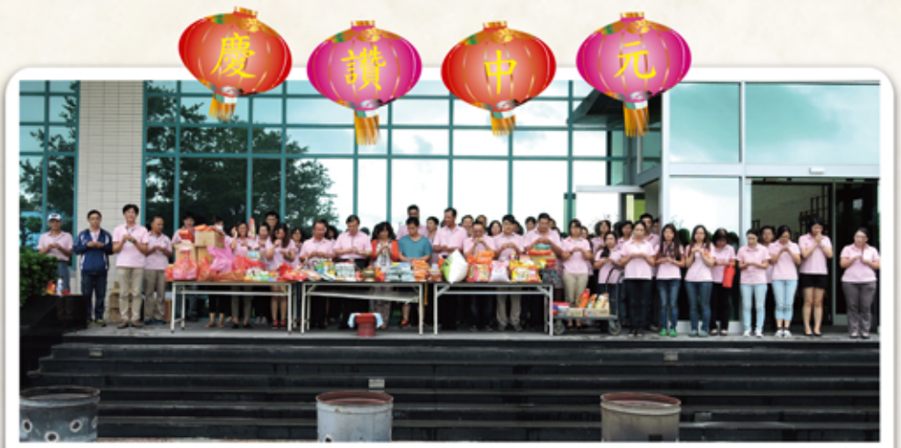
本公司董事長親率全體同仁舉行中元普渡祭拜， 祈福邦泰業績長紅，人員平安