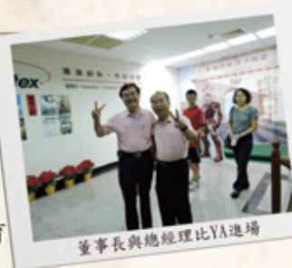
董事長與總經理比YA進場

邦泰影城，象徵公司樂於提供同仁不同學習模式與體驗的企圖，相信所有當日參與這部電影欣賞的邦泰同仁及眷屬們，都獲得人生中一次難忘的大豐收！