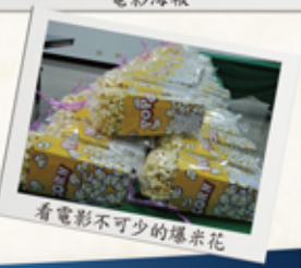
看電影不可少的爆米花