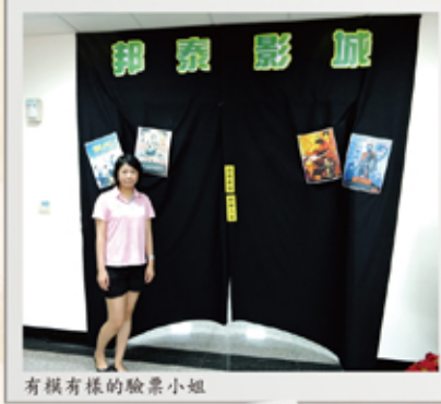
有模有樣的驗票小姐

本公司董事長特別重視員工福利與教育訓練，巧妙將兩者合而為一，用顛覆傳統的上課方式，委由本屆福委會縝密安排企劃，在8/27下午舉辦了一場別開生面的電影欣賞活動。從對號入座的電影票製作，專人劃位、驗票的安排，到看電影不可缺的歡樂、爆米花兌換準備，仿如戲院內外的佈置，各個環節堪稱有模有樣，另人驚喜讚嘆！