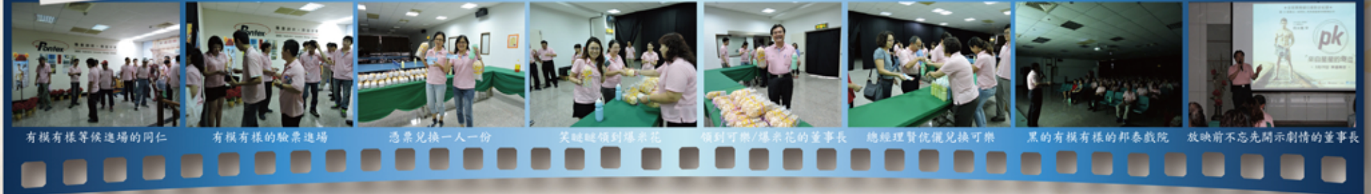
有模有樣等候進場的同仁