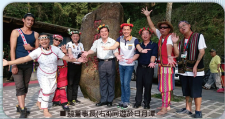
■ 饒董事長(右4)同遊於日月潭