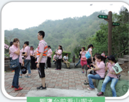
觀鷹台前看山吸水