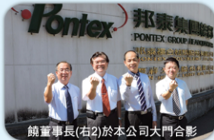
■ 饒董事長(右2)於本公司大門合影