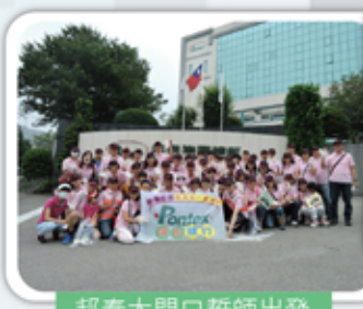
邦泰大門口誓師出發