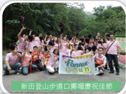
新田登山步道口戴帽慶祝佳節