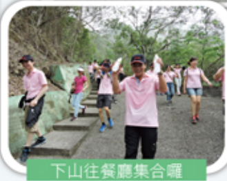
下山往餐廳集合囉