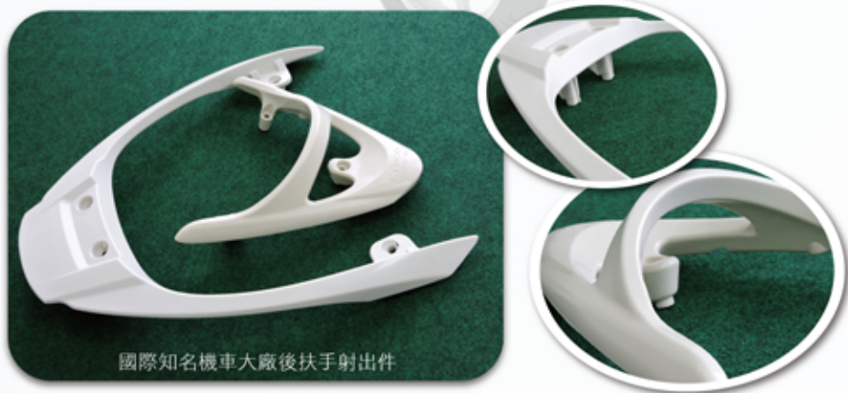
國際知名機車大廠後扶手射出件