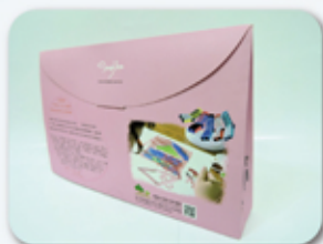
104年邦泰股東會紀念品

為感謝所有投資大眾，對邦泰公司的支持，每年在召開股東常會時，都會準備精緻的紀念品，致贈參與會議的股東。今年(104年)，為將重視公益的口號化為具體行動，公司特別選用『社團法人彰化縣小嶺頂愛啟兒關懷協會』所設計出品的愛心創作襪，採用溫馨的粉紅色系包裝，如精品手拿包典雅造型，體面大方，堪稱是近年來最內外兼修的股東會紀念贈品。