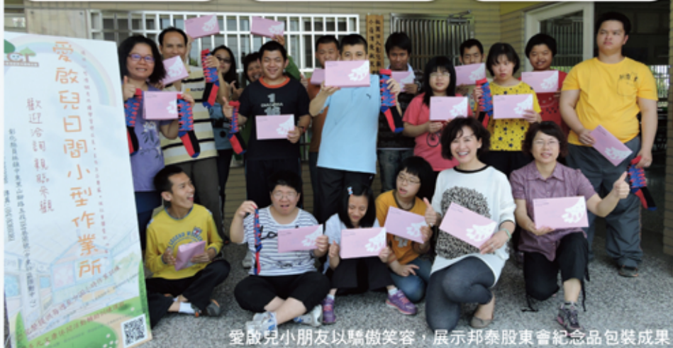
愛啟兒小朋友以驕傲笑容，展示邦泰股東會紀念品包裝成果