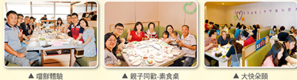
▲ 嚐鮮體驗 ▲ 親子同歡-素食桌 ▲ 大快朵頤