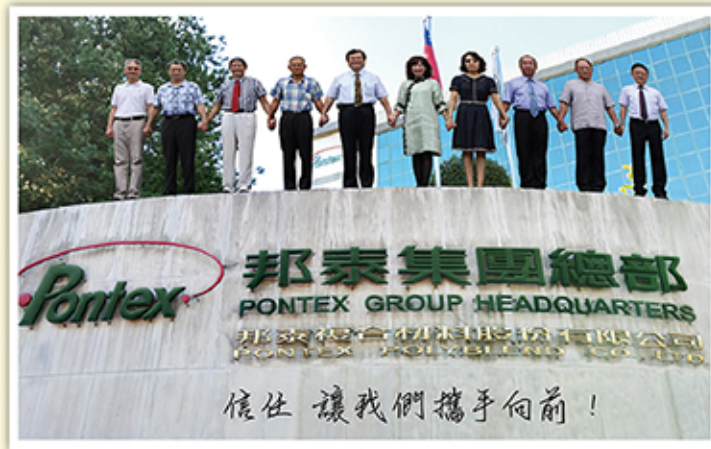
信任 讓我們攜手向前！

邦泰贏的關鍵，在於堅強的研發團隊，也在於近36年來，在複合材料無人可敵的經驗，目前在台灣、昆山、越南都有生產線，也將啟動有望膠生產界航空母艦之稱的W&P廠，我們將穩穩抓住這波全球性的大商機，發揮邦泰在複合材料的技術優勢，百尺竿頭再進一步，讓邦泰成為循環經濟中的耀眼明星！