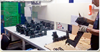
▲ 汽車水箱生產實景