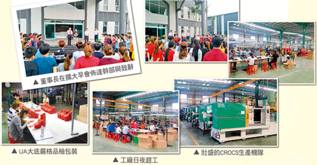
▲ 董事長在擴大早會佈達幹部與致辭