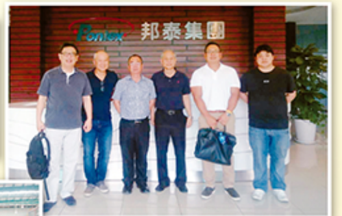
▲ Hyosung、Ascend、Tre Polymer、大草原公司貴賓於越南邦泰大廳合影