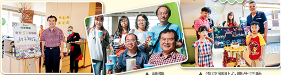
▲ 續攤 ▲ 海底撈貼心慶生活動