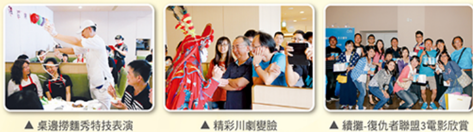
▲ 桌邊撈麵秀特技表演 ▲ 精彩川劇變臉 ▲ 續攤-復仇者聯盟3電影欣賞