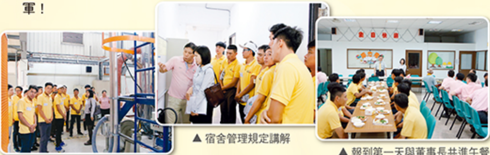
▲ 宿舍管理規定講解

董事長視員工為家人，不分台灣及海外，於16位越籍員工初來乍到當天，即一起共進午餐表達歡迎與關懷，讓遠來新同仁卸下不安，感受公司溫暖，餐後並與全體合影，展現主官高度親和力。為協助新同仁早日熟悉環境，行政單位也在人力仲介公司翻譯協助下，快速進行包括公司內外環境生活機能介紹、公司管理規章講解、消防演練等重要教育課程，每日並安排基礎中文教學，增進雙方溝通能力，期待在接受工廠專業訓練後，順利融入台灣新生活，成為邦泰真正生力軍！