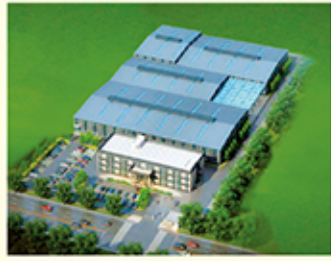
▲ 南京邦泰廠外觀3D圖

本公司以IN-HOUSE方式為南京吉茂公司生產汽車水箱，近幾月快速步上軌道，目前在有限廠房空間內，共計6台射出機投入生產，產能已突破10萬支規模，在持續累積生產經驗後，待南京建廠完成，屆時每月預計需供貨至少20萬支以上，將邦泰汽車水箱材料與非鞋類射出業務，推向新的高峰發展！