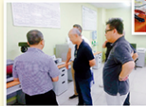
▲ 參觀越南廠品檢實驗室