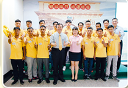
▲ 董事長與全體越籍同仁合影