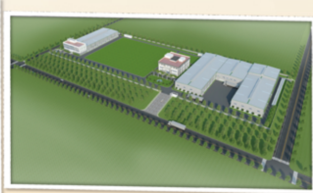
▲ 越南邦泰全廠區前景俯視圖