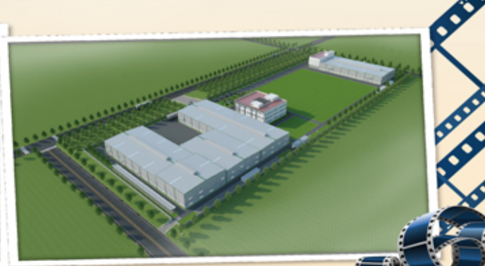
▲ 越南邦泰全廠區後景俯視圖