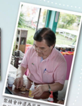
聚精會神還再苦思 做什麼好的董事長