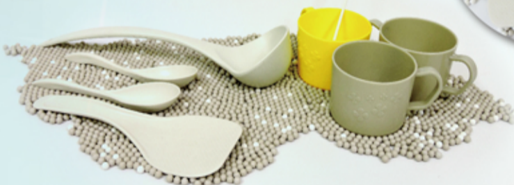
■ 邦泰PLA生分解材料-餐具、BB彈製品