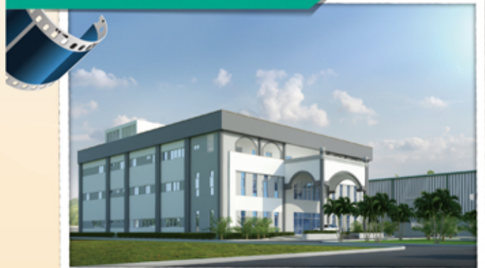
▲ 美輪美奐越南邦泰辦公大樓