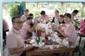
勇丫那表情八成是在想做弊