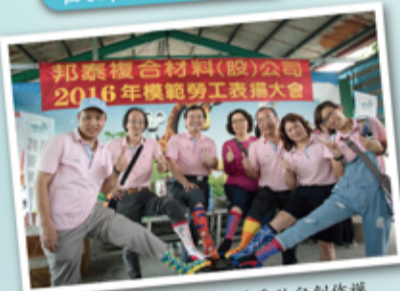
歡樂不忘公益-宣傳愛兒兒創作襪