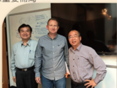
董事長、總經理於UA波特蘭總部會後留影

本公司董事長與總經理，利用4月底風塵僕僕走訪了一趟美國，密集拜訪器材多家重要客戶，包括前往Under Armour波特蘭總部拜會，以及拜訪本公司長期的品牌客戶RINGOR公司，為本公司器材下一階段發展，進行全球重要佈局。