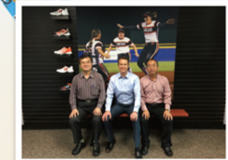
▲ 董事長、總經理與Ringor高階主管，坐在穿著邦泰開發鞋款的2015年美國女子快速壘球冠軍隊大海報前留影(邦泰圖地第5期報導產品)

本公司董事長與總經理，利用4月底風塵僕僕走訪了一趟美國，密集拜訪器材多家重要客戶，包括前往Under Armour波特蘭總部拜會，以及拜訪本公司長期的品牌客戶RINGOR公司，為本公司器材下一階段發展，進行全球重要佈局。