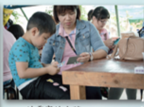
幼雲家的小孩 應該常去夜市玩賓果