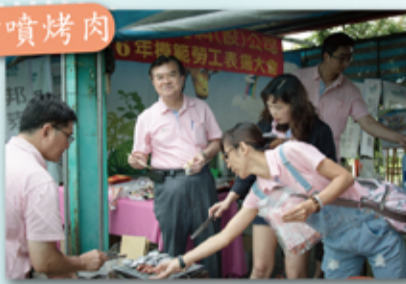
董事長的笑容應該是說 嗯好吃