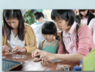
三代同堂與兩隻貓頭鷹的故事