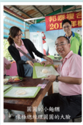
小小的麵團 等會就會變成大披薩囉