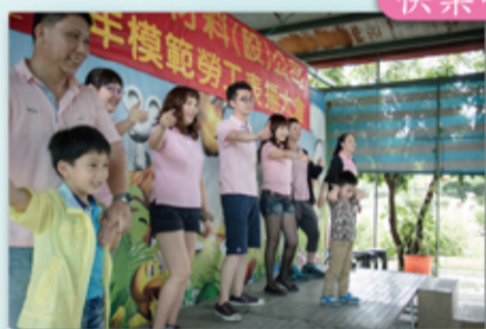
台上台下都在跳小蘋果