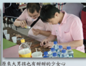
原來大男孩也有甜甜的少女心