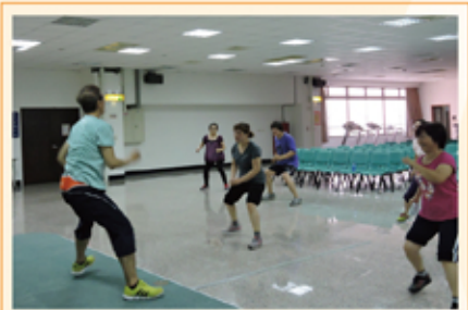
跟隨著老師賣力舞動 健康·有勁·好多氣