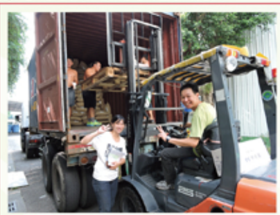
快快裝滿貨櫃·國外客戶已穿聲譽

複合材料首重產品研發，2010年底邦泰通過經濟部科專補助，領導同業，正式成立綠色高分子材料研究所，公司斥資建設有完整實驗工廠及實驗分析室，健全的軟硬體，讓專業研發團隊，成為協助業務開發最強後盾。透過品保單位先進的檢測儀器把關，邦泰始終堅守高品質的產品要求，確保生產產品在出廠前，完全符合物性標準。