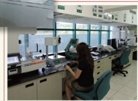
研發中心實驗分析室常見美麗忙碌的身影