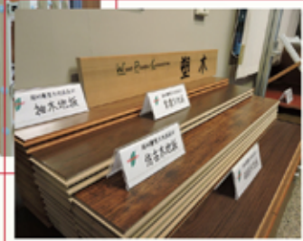
各式仿真木紋的塑木地板

複合材料為一切工業之母，邦泰取複合材料作為公司命名，象徵企業以複合材料為中心主體，與產業同存永續不滅，永遠屹立，！