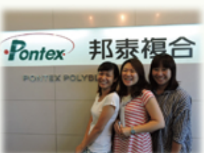
青春洋溢的業務助理

隨著業務環境變化，邦泰複材事業近幾年不斷調整產品重點，逐步朝向高值化的應用產業，著重包括汽車材料、3C電子等...；尤其在汽車水箱用途的耐水解Nylon材料、HTM高溫材料等，更是邦泰長期努力的發展重點。