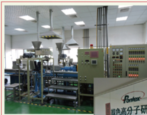
研發中心實驗工廠 可媲美一間小型工廠

複合材料首重產品研發，2010年底邦泰通過經濟部科專補助，領導同業，正式成立綠色高分子材料研究所，公司斥資建設有完整實驗工廠及實驗分析室，健全的軟硬體，讓專業研發團隊，成為協助業務開發最強後盾。透過品保單位先進的檢測儀器把關，邦泰始終堅守高品質的產品要求，確保生產產品在出廠前，完全符合物性標準。