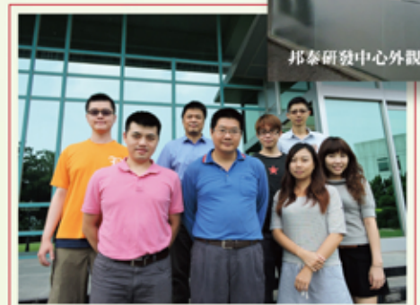
邦泰研發中心外觀